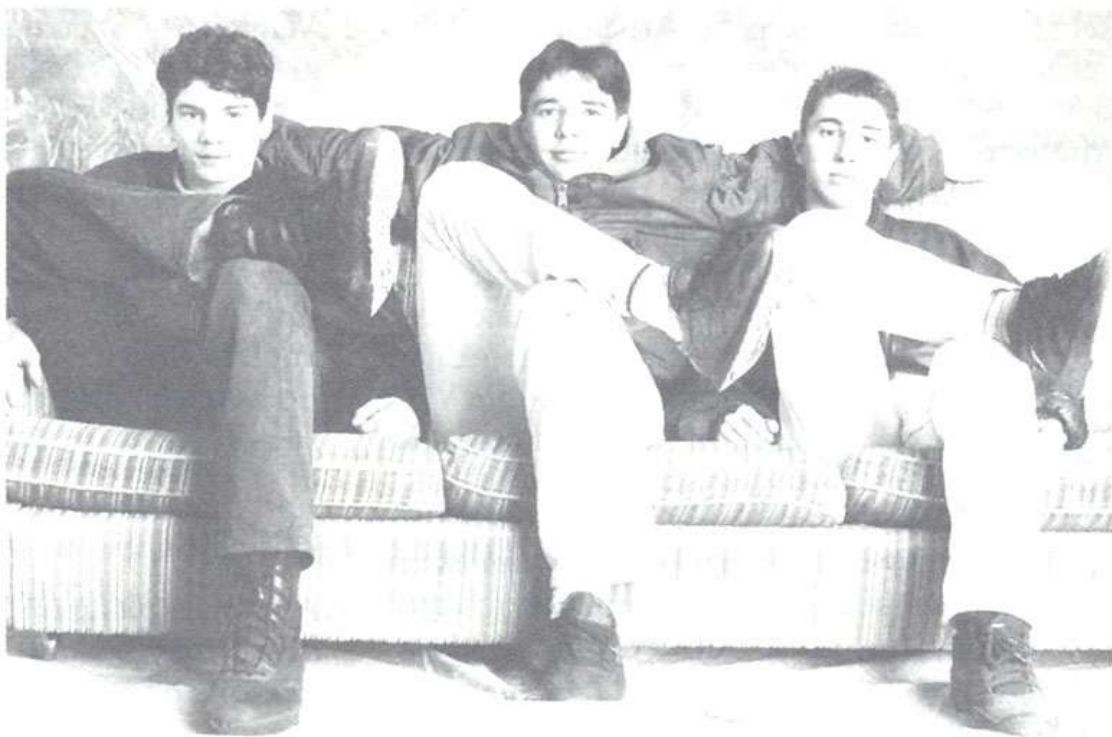
Aus dem Katalog „Bilder von Jugend“

verharmlosen, es gibt natürlich auch massive Konflikte: Manche Münchner Freizeiteinrichtung singt ein garstig Lied von jungen Albanern, deren Integration einfach nicht gelingen will. Die jungen Männer, inmitten und mit Gewalttätigkeiten groß geworden, vielfach traumatisiert und einer überwiegend vorindustriellen Gesellschaft entstammend, überfordern häufig deutsche Sozialpädagoginnen und ihre Kollegen. Die Jugendlichen sind aber auch dankbar und kooperativ, wenn man sie ernst nimmt, ihnen zuhört, Raum gibt und sie gewähren lässt. Oder die deutschen Aussiedlerjugendlichen aus Osteuropa und der ehemaligen Sowjetunion: Auf sie ist beispielsweise das Kriminologische Forschungsinstitut Niedersachsen aufmerksam geworden, als man die überraschenden Kriminalitätsbelastungen einiger niedersächsischer Landkreise untersuchte und festgestellt hat, dass dort viele Aussiedlerfamilien angesiedelt worden waren. Deren Kinder sind oft gegen ihren Willen, über Nacht, aus gewachsenen Strukturen heraus gerissen worden. Und das gelobte Land, die Heimat der Ahnen, nahm sie gar nicht freundlich auf, die neuen Deutschen. Die Verzweiflung der „Russen“ mündet häufig in Gewalt und Drogen, sie sehen sich als Deutsche, werden wie Ausländer behandelt - und rebellieren.