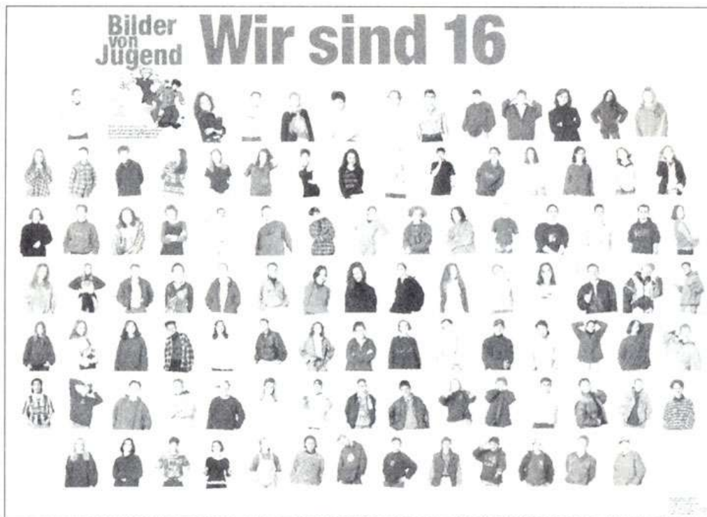
Plakat zu „Bilder von Jugend“

beide Elternteile „richtige“ Türken sind. Wir kennen sie vielleicht doch nicht, sondern weisen ihnen kulturelle Eigenheiten zu, ethnisieren und begünstigen Selbstethnisierungsprozesse. Die Vielfalt gestaltet sich vielfältiger als gedacht. Das Münchner Medienprojekt „Bilder von Jugend“ verdeutlicht das durch Interviews mit 100 Jugendlichen (BMW AG 1996). Die Komplexität von Individuen und die ihrer Lebenszusammenhänge kann nicht auf kulturspezifische Merkmale reduziert werden. Aber ebenso wenig sollten die „kulturellen Einbettungen“ der Jugendlichen, wie Alfred Scherr (2001) es benennt, ignoriert werden. Diese leiten sich allerdings nicht nur durch die Herkunft der Eltern ab. Wie sich eine Gesellschaft durch Migration verändert, verändern sich auch Menschen durch den Prozess der Migration. So ist eines der Ergebnisse einer Kinderbefragung (DJI 2000), wie Kinder ihren multikulturellen Alltag erleben, dass sie über vielfältige und stabile Kontakte zu Gleichaltrigen verfügen. Ihre Freundeskreise sind heterogen. Die Kinder haben zwar ein Bewusstsein und differenzierte Wahrnehmung von unterschiedlicher Herkunft, leben aber in erster Linie selbstverständliche und alltägliche Kinderkultur. Dass sie hierbei eine größere Bandbreite an Lebensstilen erfahren, stellt für sie per se noch kein Problem dar.